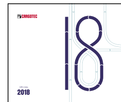
GRI-indeksi 2018 (englanniksi)