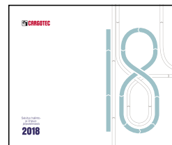
Selvitys hallinto- ja ohjausjärjestelmästä 2018