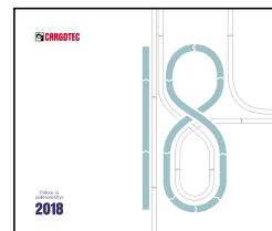
Palkka- ja palkkio- selvitys 2018