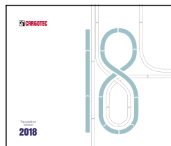
Taloudellinen katsaus 2018