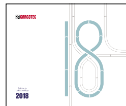
Palkka- ja palkkio- selvitys 2018