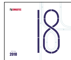
GRI-indeksi 2018 (englanniksi)