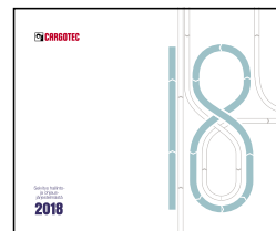
Selvitys hallinto- ja ohjausjärjestelmästä 2018